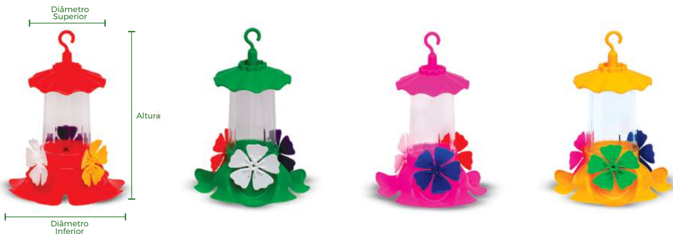
Código: 526-6 Vermelho

Diâmetro Superior: 9cm. Diâmetro Inferior: 14cm. Altura: 21cm. Volume: 220ml