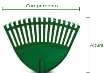
Vassoura Plástica N° 16

As vassouras podem ser utilizadas na manutenção do seu jardim ou quintal, pois possuem “dentes” que facilitam a remoção de maior quantidade de folhas.