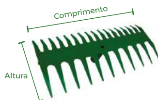
Vassoura Plástica Dupla