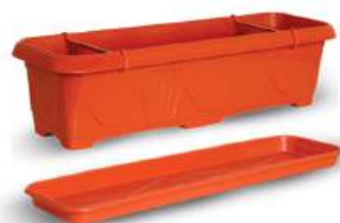
N° 04 Cerâmica