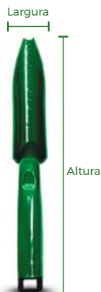
Pazinha N° 1

As pás são ideais para plantio de pequenas a grandes mudas. Possuem acabamento liso e brilhoso com detalhes em alto relevo, um cabo anatômico com apoio para o polegar e resistente, além de uma régua de 10 cm na sua concavidade. O Mini Rastelo é um modelo ideal para ser utilizado na manutenção de pequenos jardins, pois o mesmo possui três resistentes “dentes” facilitando o manuseio da terra. Esses produtos são produzidos em resina de polipropileno.